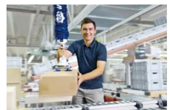
Hebesysteme und Krane